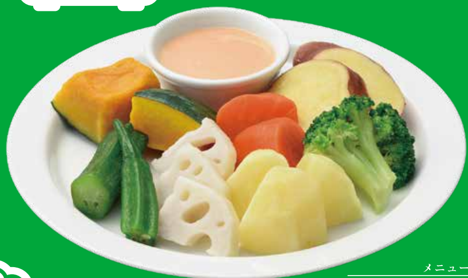
メニュー使用例 ガロニ、野菜カレー、パーニャカウダーなど